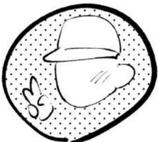
モブ君 調子乗りの童貞大学生