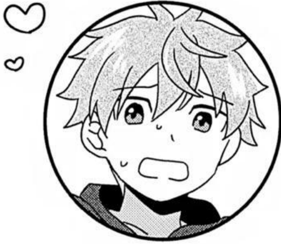
あきやま はやと 秋山 隼人